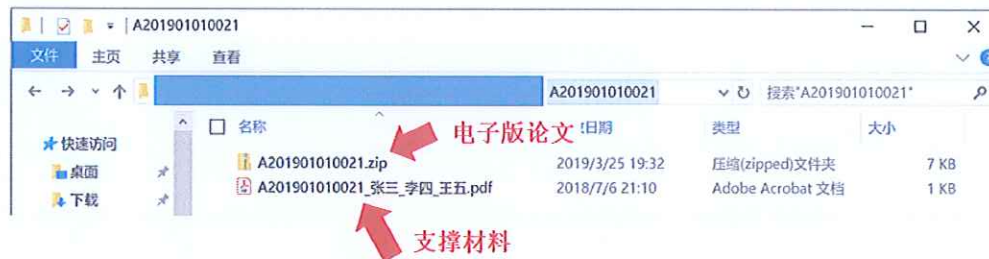
图4 电子版论文文件示意图

(2) 支撑材料 ：包括用于支撑参赛论文中模型、结果和结论的所有必要材料，通常应包含所有可运行的源程序、自己查阅并使用的数据和难以从公开渠道找到的相关资料等。使用 WinRAR 压缩为一个文件。