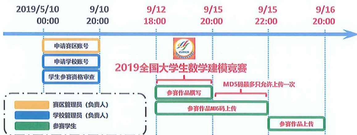
图1 2019全国大学生数学建模竞赛时间示意图

赛区组委会、参赛学校和参赛队报名注册与参赛的相关事项、时间节点及说明如图1和表1所示。