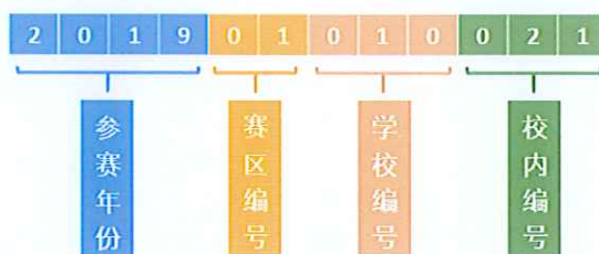
图 2 参赛队号的含义示意图